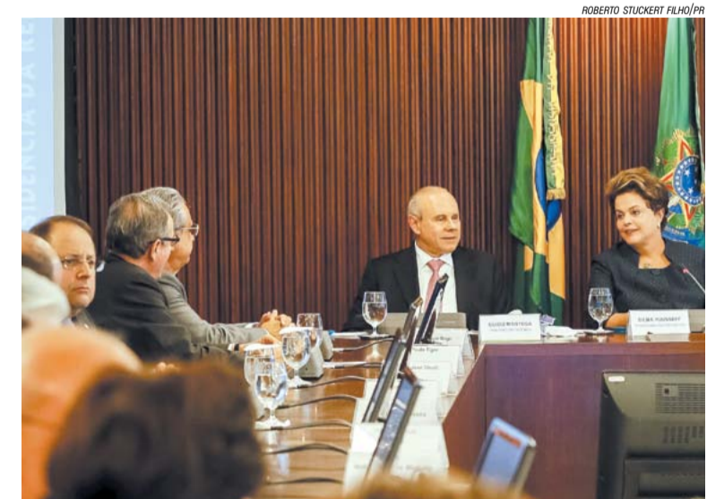
Mantega e Dilma anunciam pacotes de incentivo para a indústria

O PSI ganhará ainda uma modalidade que financiará a modernização de fábricas, o subprograma oferecerá