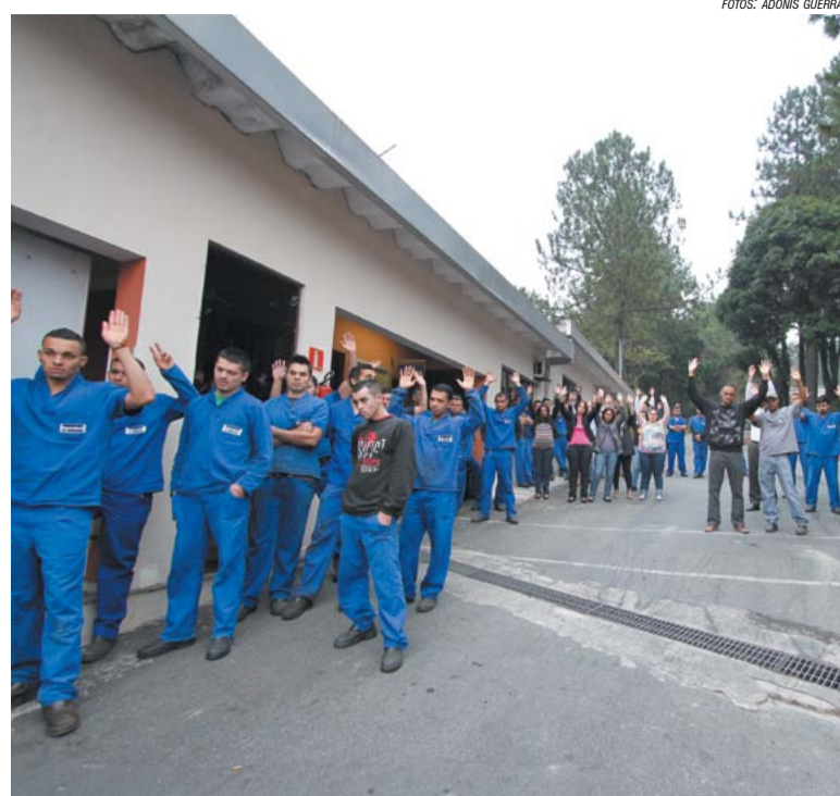
Trabalhadores na Apema durante assembleia na última quarta

Após duas rejeições, um protesto de duas horas e aviso de greve, os trabalhadores na Apema, em São Bernardo, aprovaram a Participação nos Lucros e Resultados negociada pelo Sindicato, durante assembleia na portaria da fábrica na manhã da última quarta.